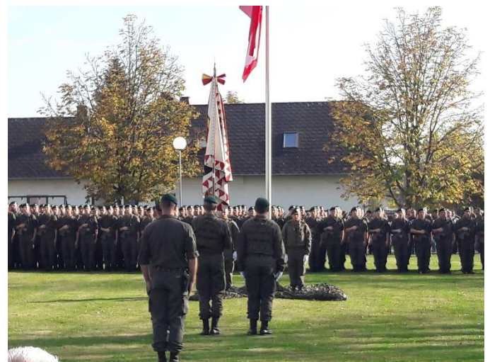
Foto Angelobung Bundesheer 26. Oktober 2019