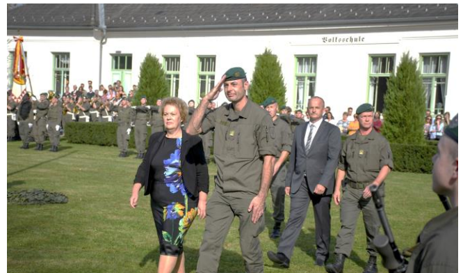
Foto Angelobung Bundesheer 26. Oktober 2019