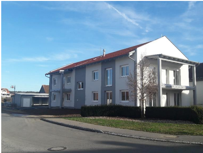
Wohnhausanlage Tobaj-neu - Dezember 2019

Interessierte Personen werden gebeten sich beim Gemeindeamt Tobaj 03322/42458 oder beim Bürgermeister Kopeszki Helmut unter der Nr. 0664/6479787 zu melden. (1 Wohnung noch frei)