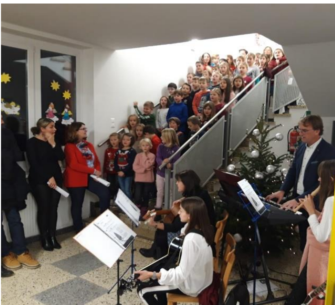
Foto Adventfeier VS Deutsch Tschantschendorf

Die Volksschule Deutsch Tschantschendorf hat auch 2019 wieder zur Adventfeier in die VS Deutsch Tschantschendorf eingeladen. Zahlreiche Musik- u. Gesangsstücke wurden von den Schulkindern den anwesenden Eltern und weiteren Gästen vorgetragen.