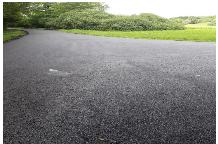
Foto – Teilabschnitt Punitz Meierhof

Die Instandsetzungsarbeiten/Generalsanierungen der Güterwegabschnitte Tobaj/Hasendorf bzw. ein Teilbereich des Güterweges Punitz/Meierhof wurden 2019 von der Firma Swietelsky fertiggestellt.