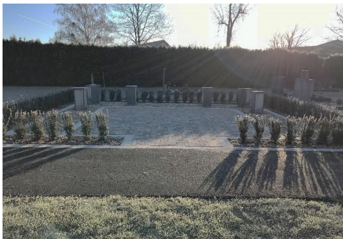
Foto Urnenplatz Deutsch Tschantschendorf

Die Urnenäulenplätze in Punitz und D. Tschantschendorf sind fertiggestellt. In Punitz sind von 4 Urnenäulen 3 und in D. Tschantschendorf sind alle 6 Urnenäulen vergeben, deshalb werden dort im Jahre 2020 noch 2 weitere Urnenäulen aufgestellt. Die Urnenplätze sind für jeweils 10 Urnenäulen konzipiert. Interessierte Bürger werden ersucht sich bei der Gemeinde Tobaj zu melden.