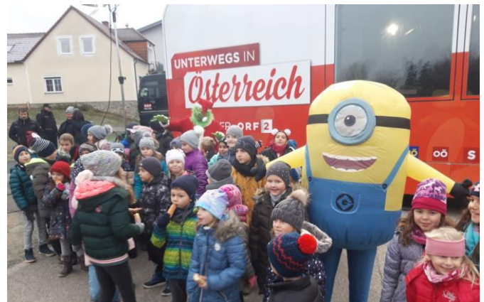
Foto Guten Morgen Österreich Studio am 12.12.2019

Für die Gemeinde Tobaj war es natürlich ein doch „Anderes Erlebnis“. Am Donnerstag, den 12. Dezember 2019 von 06.30 Uhr - 09.30 Uhr war es soweit, die Gemeinde Tobaj war Live in der Guten Morgen Österreich Sendung vertreten.