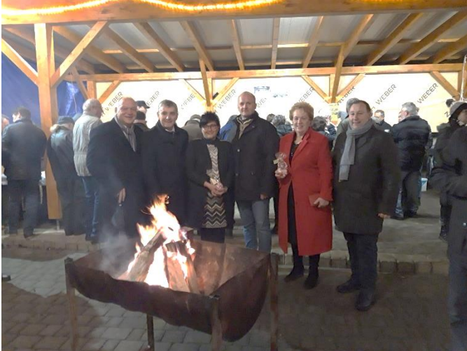
Foto Adventfeier Bürgermeister 21. Dezember 2019