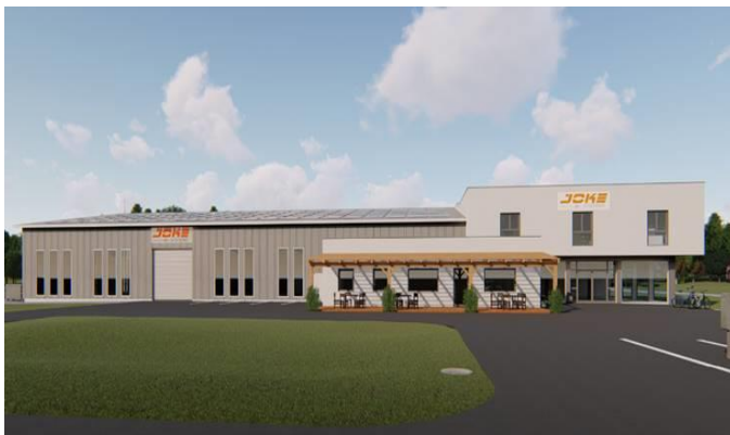
Fotobild Betriebsgebäude Joke-Systems nach Fertigstellung

Die Gemeinde Tobaj freut sich natürlich, mit der Firma Joke-Systems GmbH einen neuen Betrieb in der Gemeinde Tobaj willkommen heißen zu dürfen. Ein Hauptanliegen der Gemeindepolitik muss auch zukünftig darin liegen, Betriebe auf den diversen Betriebsgebieten der Gemeinde Tobaj anzusiedeln.