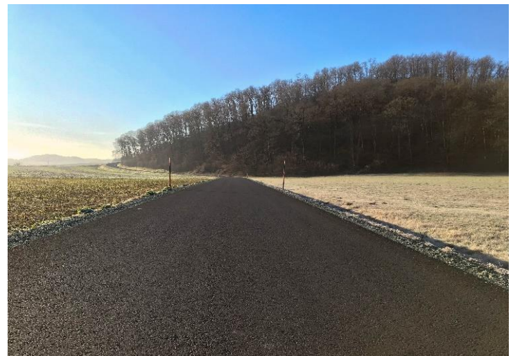
Foto Straße nach Hasendorf