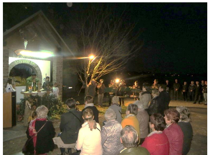
Foto Hubertusmesse in Deutsch Tschantschendorf

Im Anschluss an die Messfeier luden die Jäger zum Wildgulaschessen ins Gasthaus Walits-Guttmann ein, wo die Ortsbevölkerung gemeinsam mit den Jägern einen wunderschönen Herbsttag ausklingen ließ.