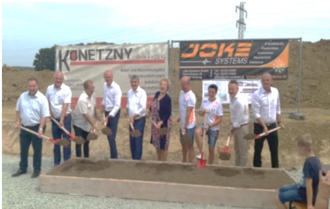
Foto Spatenstichfeier Joke-Systems 24.08.2019

Die Gemeinde Tobaj freut sich natürlich, mit der Firma Joke-Systems GmbH einen neuen Betrieb in der Gemeinde Tobaj willkommen heißen zu dürfen. Ein Hauptanliegen der Gemeindepolitik muss auch zukünftig darin liegen, Betriebe auf den diversen Betriebsgebieten der Gemeinde Tobaj anzusiedeln.