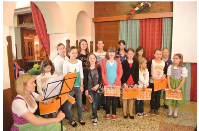
Jugendchor Deutsch Tschantschendorf