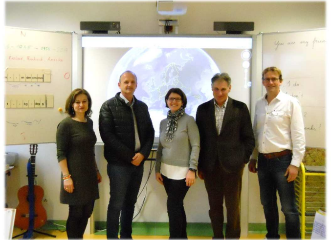
Kreidetafel durch SMART-Borad

Auf Grund dieser sehr positiven Erfahrungen mit dem SMART Board wird angestrebt, auch die zweite Klasse mit diesem digitalen Medium auszustatten, damit alle Lehrer/innen und Schüler/innen in den Genuss eines noch zeitgemäßen Unterrichts kommen.